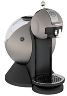
NESCAFÉ® Dolce Gusto® 돌체구스토